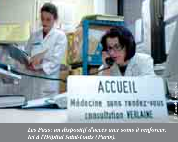
Les Pass: un dispositif d'accès aux soins à renforcer. Ici à l'Hôpital Saint-Louis (Paris).